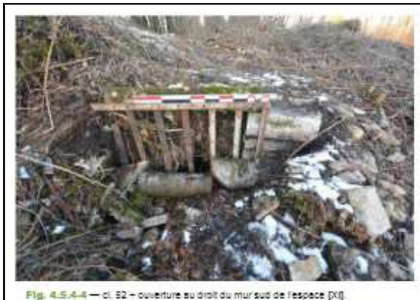
Fig. 4.5.4.4 — cl. 52 — ouverture au droit du mur sud de l'espace [XII]

On retrouve des citations laissant à penser qu'une partie du château fût habitée jusqu'à la fin du XIX e siècle.