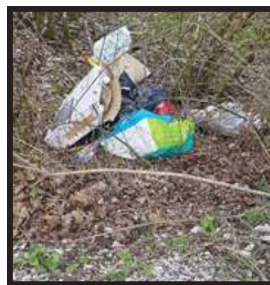
Déchets retrouvés le 16/04/21, au bord du Tacot direction Pugey, proche du parking de chasse.

La destination finale de ce type de déchets doit être la déchetterie.